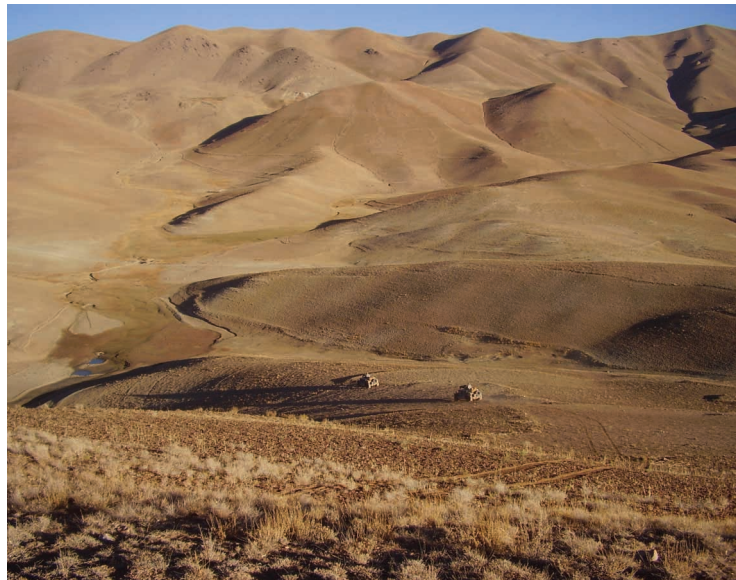
Patrulis. Vieniši begalybėje ir amžinybėje.

Blogai būna, kai vėjas pučia iš vakarų. Tada nuo dulkių miestelis dūsta. Visi kuo greičiau lenda į palapines. Sargybiniams, ypač vakariniuose bokšteliuose, kliūva daugiausia – pakilimo takas vos už keliolikos metrų. Muistosi jie. Dangsto akis rankomis, maukšlina ant veidų žalsvas skareles... Iš tikrųjų daro taip ne dulkių saugodamiesi – tai įprasta kasdienybė, o tiesiog dėl pasitaikiusios progos pajvairinti