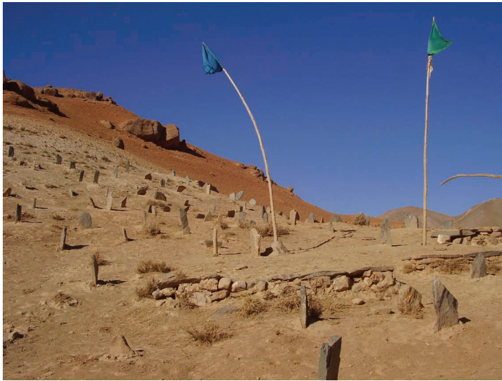
Kalno šlaite suguldė sustingusius kūnus.

kurie slenka dangumi ir pamažu leidžiasi žemyn, viską užklodami lipniu gelsvumu.