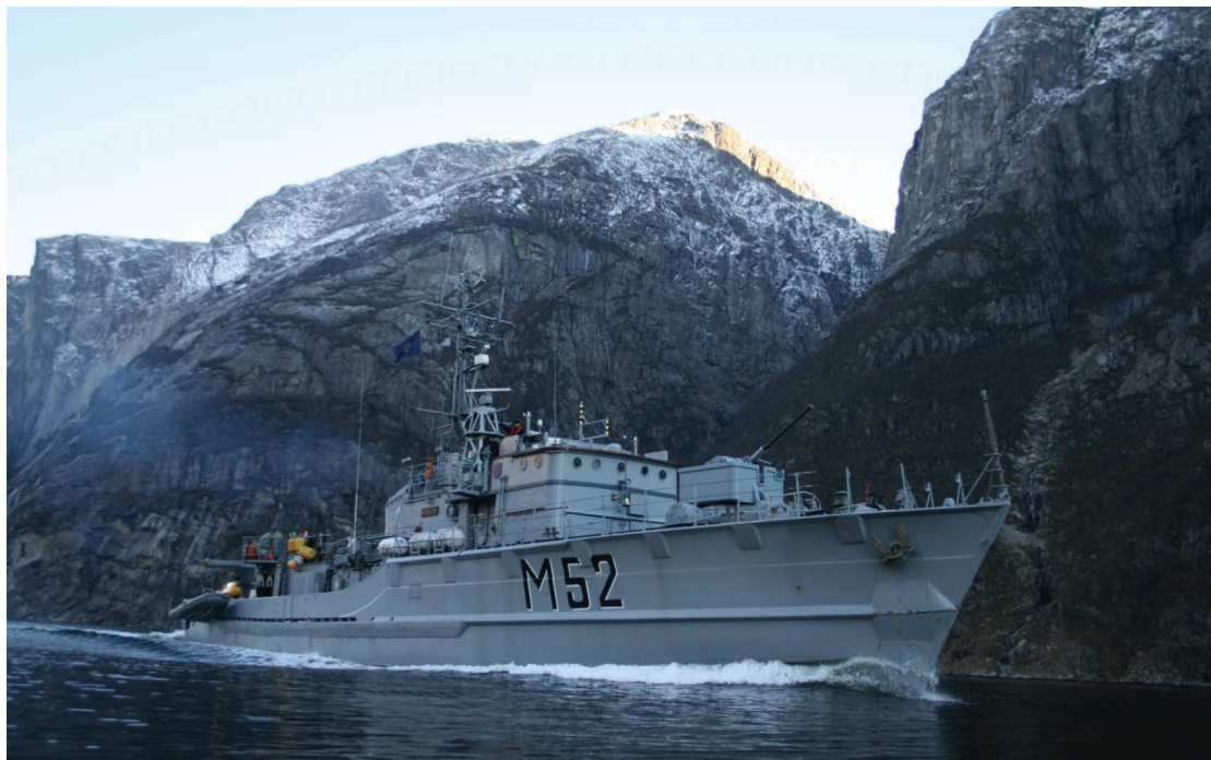
„Sūduvis“ išminavimo operacijoje Norvegijos fjorduose.