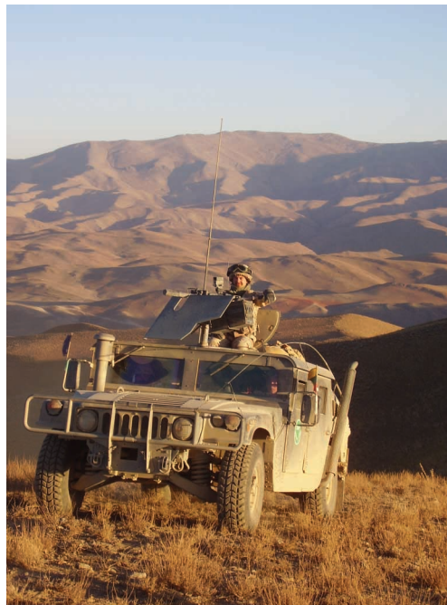
Patrulis. Artėja vakaras.

„Hercules“ pilotai nekantrauja. Jiems dar reikia į Mazari Šarifą vokiečius, dalyvavusius pasitarime, skraidinti. Skubiai traukiamos lauk ir kraunamos į sunkvežimį ilgai lauktos paletės su kroviniu. Danai ir karininkai sulipa į automobilius ir lydimi poros „Hammer“ su atidengtais kulkosvaidžiais,