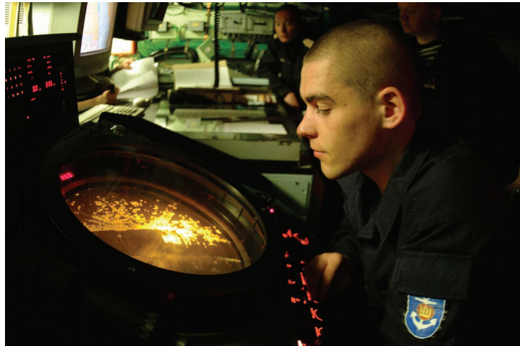
Įgulos narys stebi lokatoriaus ekraną.

Tuo metu laivas nuo sproginimo vietos būna nutolęs saugiu atstumu - apie 250 metrų. Prieš