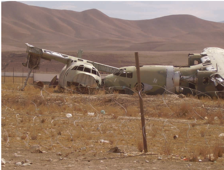
Meilė ir mirtis Mėnulio slėnyje.