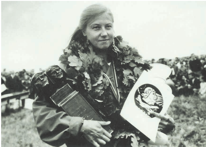
Brangus laimėjimas – Dariaus ir Girėno taurė. 1998 metai.

Skrydis aplink Žemę – sunkus darbas, jį reikia šlovinti.