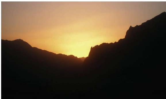
Hindukuše aušta nauja diena.

Kapitonui yra tiktai du neišmatuojami, neaprėpiami, niekada iki galo nepažinti ir nesuvokti grožiai: žmogaus siela ir žvaigždėtas dangus. Kad ir kiek žiūrėtum į Paukščių taką, juo skrendančią Gulbę, amžinuosius ratus apie Šiaurinę sukančius Grįžulus, kad ir kaip besistengtum suvokti begalybės esmę ir prasmę – niekada ir niekam iš mūsų nepavyks to padaryti. Net šiurpas ima!