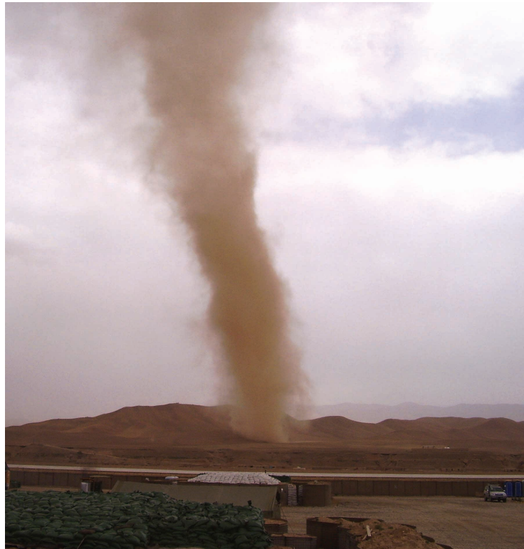
Afganis keliauja Pusta-i-Takhal kalnagūbriu.

Toli, labai toli nuo didesnių miestų ir geresnių kelių, Pušta-i-Takhal ir Darrahe Oyagha kalnagūbrių iš visų pusių apglėbtas, sraunios, bet niekur taip ir neįtekančios Harirūdo upės į dvi, beveik lygias dalis perskirtas, pačiame Afganistano centre tyso Mėnulio slėnis. Ilgas ir platus. Užtvindytas išretėjusiu kalnų oru ir ryškia saulės šviesa, kurioje per vidudienio maldą žmogaus šešėlis tik dviejų pėdų ilgio. Slėnis daugumai ateivių atrodo nuobodus. Vienspalvis. Iš pirmo žvilgsnio nykus ir visiškai be gyvybės.