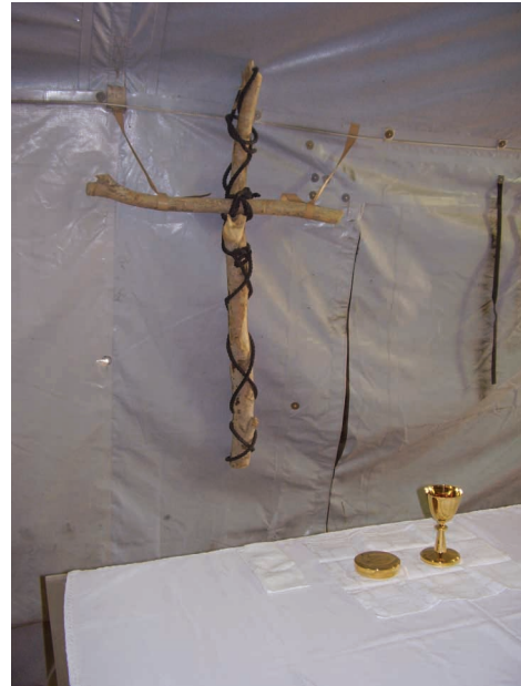
Tikiu į Dievą Tėvą... „Whisky“ stovyklos koplyčios altorius.

Klausimai ir atsakymai iš anksto žinomi. Tai lyg koks žaidimas. Kelyje ar kaime sutiktas žmo-gus, dažniausiai jau iš anksto žino patrulių klausimus ir turi parengęs „teisingus“ atsakymus. Tik gerai